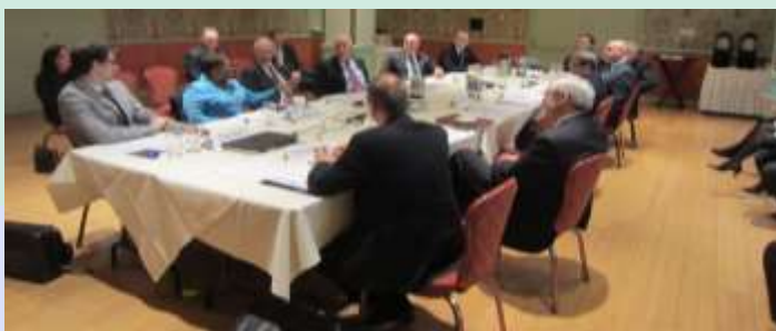
Le conseil d'administration de l'Alliance lors de sa rencontre de mi-année en décembre 2012, à Milwaukee (Wisconsin).