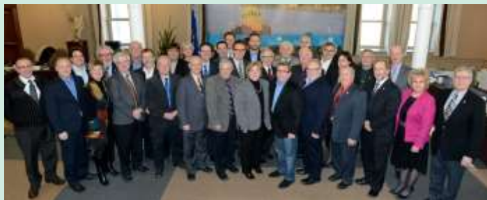
Les maires québécois de l'Alliance lors de la rencontre régionale du 25 janvier 2013.

Plus d'une quarantaine de maires et autres représentants de municipalités riveraines du Saint-Laurent ont participé aux quatre rencontres régionales des membres québécois, tenues à Québec en 2012-2013. Ces rencontres, tenues à l'initiative de M. Régis Labeaume, maire de Québec, président de la Communauté métropolitaine de Québec et secrétaire-trésorier de l'Alliance, ont mené à la création de plans d'actions sur différents enjeux partagés, tels que la protection et la restauration des berges, les niveaux d'eau, le Plan d'action Saint-Laurent, les espèces envahissantes, le transfert des ports régionaux et l'exploration et l'exploitation d'hydrocarbures. L'Union des municipalités du Québec (UMQ) a aussi participé à ces rencontres en tant qu'observatrice. L'équipe de l'Alliance a travaillé étroitement avec un maire désigné à chaque enjeu sélectionné afin de faire avancer le plan d'action. Les rencontres régionales québécoises ont permis une convergence des leaders municipaux sur des enjeux partagés, la promotion du travail de l'Alliance et ultimement, la croissance de l'effectif québécois de l'Alliance.