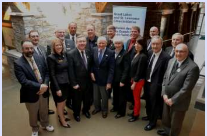
Les maires de villes ontariennes lors d'une rencontre régionale.

Au cours de la prochaine année, l'Alliance poursuivra sa collaboration avec les gouvernements fédéral et provincial dans le cadre du PASL afin d'assurer que la voix des maires soit entendue lorsque les enjeux du fleuve sont discutés, notamment au sujet de la demande de la mise en place d'une table de concertation nationale.