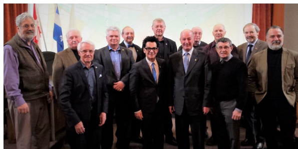
Des maires québécois se rassemblent pour la première réunion du Caucus des maires du lac Saint-Pierre.

La pollution de nos cours d'eau par les éléments nutritifs demeure un enjeu prioritaire pour les maires de l'Alliance et nous continuons nos efforts afin de réduire cette pollution en Ontario, au Québec et aux États-Unis. Depuis décembre 2015, l'Alliance travaille en partenariat avec l'Ontario Federation of Agriculture (OFA) afin de développer une stratégie collaborative de drainage des terres agricoles afin de trouver une solution au problème de rejet de phosphore dans la rivière Thames, qui se jette dans le lac Érié. Au cours de la dernière année, l'Alliance et OFA ont rassemblé des partenaires locaux, les Premières Nations, les représentants du secteur agricole, les organismes non-gouvernementaux et les municipalités afin de travailler sur la stratégie d'une durée de 5 ans. En décembre 2016, la stratégie a reçu une subvention de plus de 200 000$ de la part du programme Canada-Ontario Cultivons l'avenir 2. Les organismes participants ont aussi contribué 100 000$. Un comité de direction du projet, présidé conjointement par M. Randy Hope, maire de Chatham-Kent et membre du conseil d'administration de l'Alliance, et M. Mark Reusser, membre du conseil d'administration de l'OFA, a été créé. Au cours de la prochaine année, OFA et l'Alliance vont assembler les meilleures pratiques de drainage, discuter avec les agriculteurs de la région et commencer à planter la stratégie.