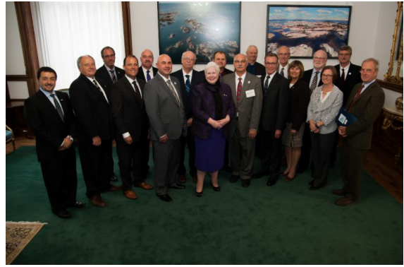
Son Honneur Elizabeth Dowdeswell et des maires de l'Alliance des villes

Le 6 octobre dernier, l'Alliance a tenu sa première Journée des Grands Lacs à l'assemblée législative de l'Ontario, à Toronto. Plus de 20 maires et élus municipaux de l'Alliance ont rencontré différents ministres ainsi que des élus des deux partis d'opposition. Le ministre des finances de l'Ontario, M.