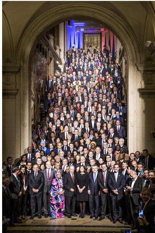
Le groupe de maires au Sommet des élus locaux sur le climat

Cliquez ici pour efforts de réduction des gaz à effet de serre de nos villes membres - Fiche d'information