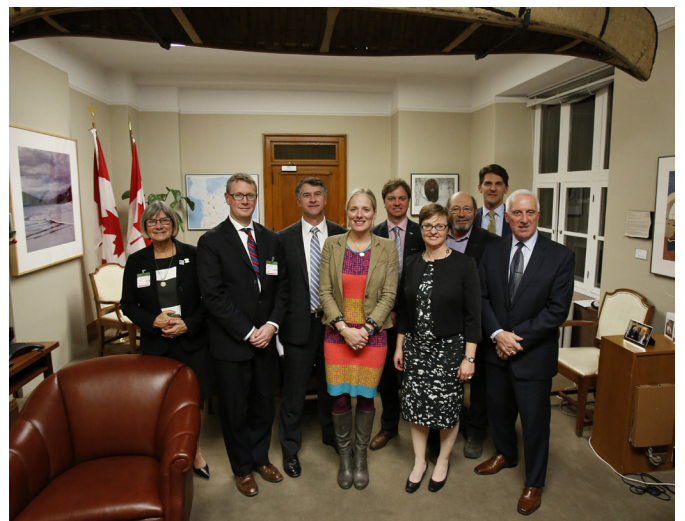
Maires et employés de l'Alliance des villes avec la ministre Catherine McKenna.

En novembre 2017, l'Alliance des villes a tenu la deuxième édition annuelle des Journées Grands Lacs-Saint-Laurent à Ottawa, en collaboration avec des organismes partenaires, soit le Council of the Great Lakes Region, la Commission des pêcheries des Grands Lacs, Freshwater Future et Stratégies Saint-Laurent. Plus de vingt personnes représentant les villes, les entreprises, les ONG environnementales et les pêcheurs y ont assisté et ont rencontré plus d'une douzaine de représentants du gouvernement canadien, y compris des députés, des sénateurs, des fonctionnaires et la ministre McKenna. L'appui à la Stratégie collaborative Grands Lacs-Saint-Laurent a été le point central du message de la délégation au cours de cette journée, la plus importante du genre jamais tenue de l'Alliance.