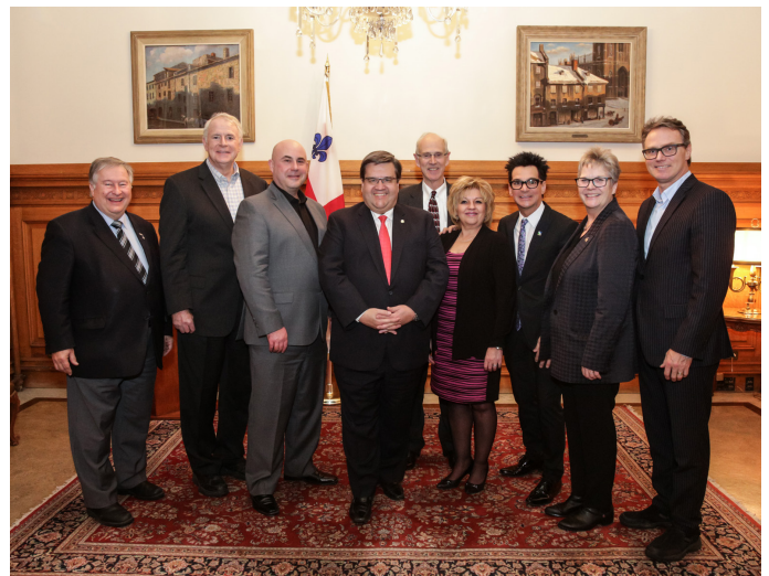
Des membres du Conseil d'administration lors de la rencontre de mi-année 2017 à Montréal, Québec.